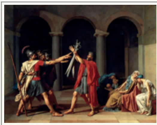
Le serment des Horaces , Jacques Louis David, 1784 - 1785