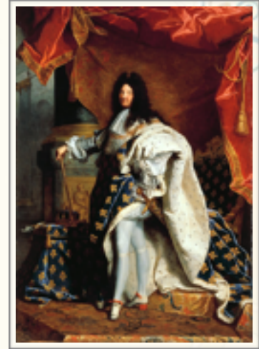
Louis XIV en costume de sacre , Hyacinthe Rigaud, 1701

Quelques références artistiques sur l'académisme :