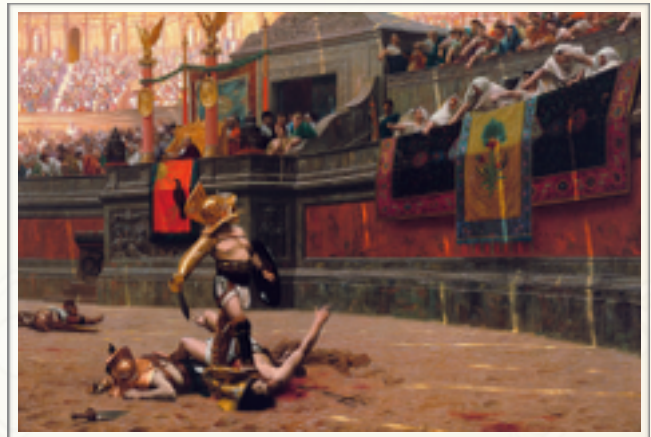
Jean-Léon Gérôme, Pollice Verso , 1872