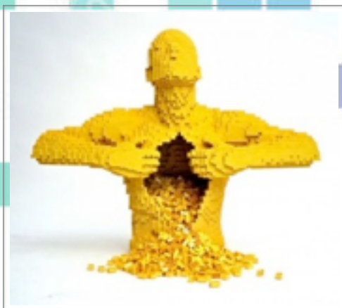
Ci-dessous, Sculpture en Lego de Nathan Sawaya et Thomas Broomé, pixel low , res man