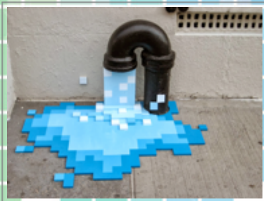
Ci-contre, Installation de Kelly Goeller à New-York :