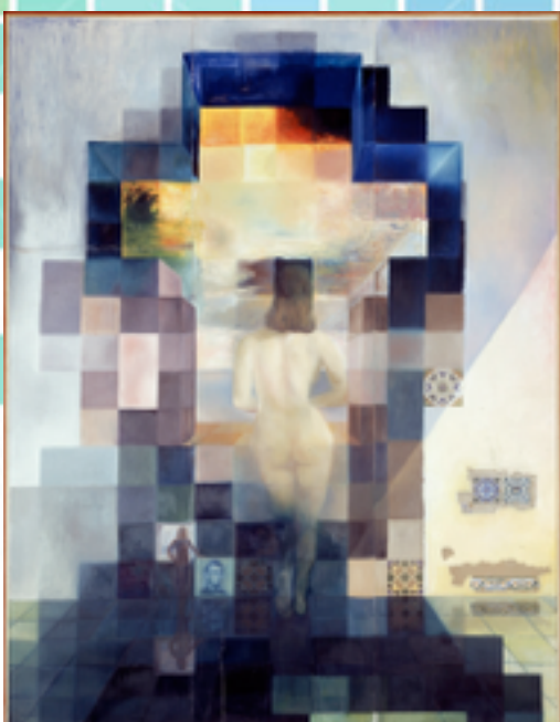
Lincoln , Dali, 1975