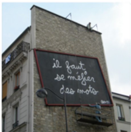
Ben, il faut se méfier des mots , 1993, Paris XXème, Installation, Street Art