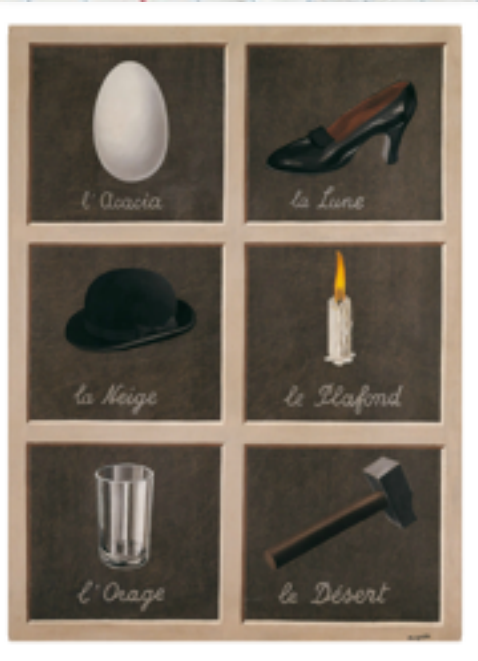
La clé des songes , Magritte, 1930