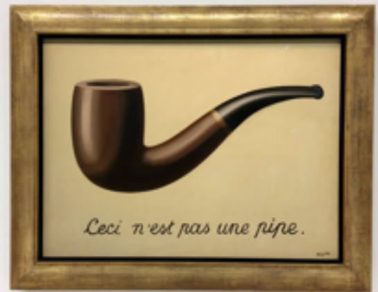
Magritte, La trahison des images , 1928-1929, huile sur toile, 59 x 65 cm, Los Angeles