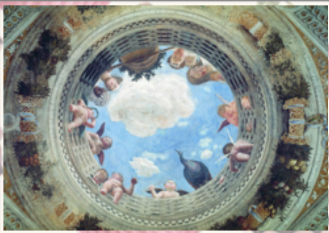
Trompe-l'œil d'Andrea Mantegna, La Chambre des Époux , Château Saint-Georges (Mantoue).