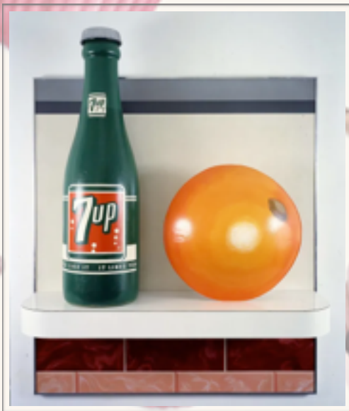
Tom Wesselmann, Still Life No.49 , 1964 © © Succession Tom Wesselmann/ SODRAC, Montréal/VAGA, New York (2012)

Toile rembourrée de mousse de polyuréthane et de boîtes de carton, peints (peinture vinylique) 1,48 x 2,9 x 1,48 cm © Claes Oldenburg