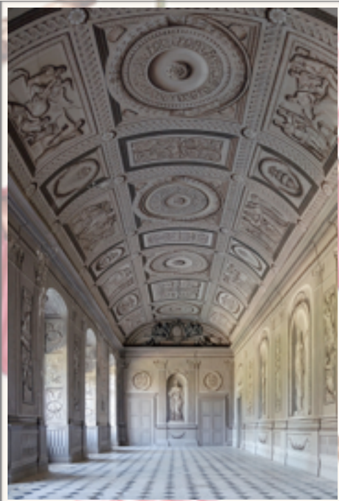
Galerie décorée de grisailles traitées en trompe-l'œil du château de Tanlay (Yonne).