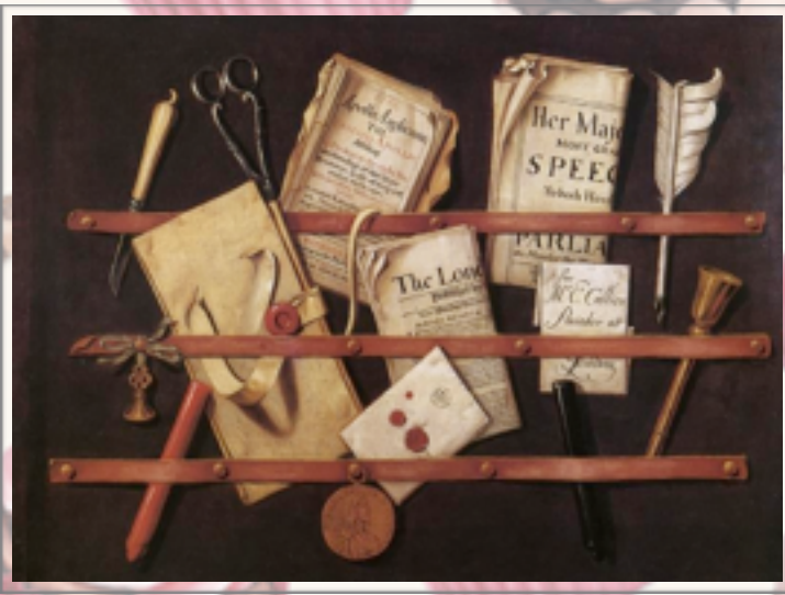
Trompe-l'œil d'Edwaert Collier (vers 1699).