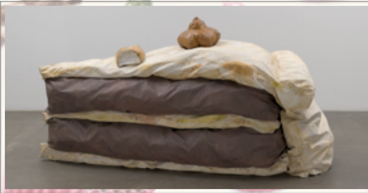
Claes Oldenburg Floor Cake , 1962

Toile rembourrée de mousse de polyuréthane et de boîtes de carton, peints (peinture vinylique) 1,48 x 2,9 x 1,48 cm © Claes Oldenburg