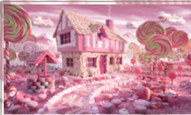
Carl Werner et ses paysages de nourriture, appelés Foodscape