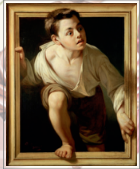
Fuyant la critique , huile sur toile de Pere Borrell del Caso, Madrid (1874).