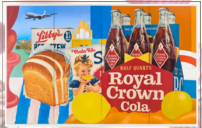
Tom Wesselmann, Still Life No.35 , 1963 © © Succession Tom Wesselmann/ SODRAC, Montréal/VAGA, New York (2012) Photo : Jeffrey Sturges