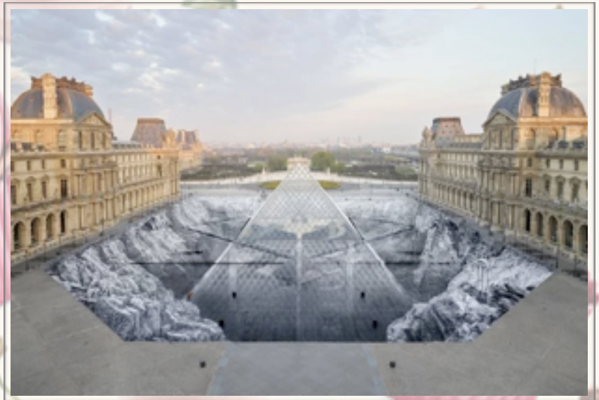
Anamorphose de JR au Louvre